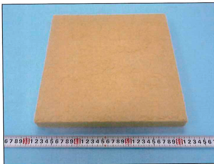
写真1 試験体の外観