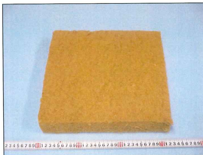
写真1 試験体の外観