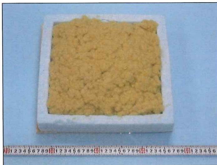
写真1 試験体の外観